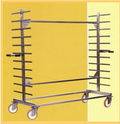
ESTANTERÍA SOBRE RUEDAS CON ESTANTES EN PE O MADERA