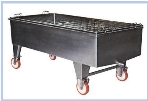
CUBA PARA LA RECOGIDA DE