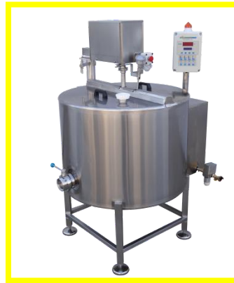
TINAS DE COCCIÓN MULTIPOWERED CALEFACCIÓN ELÉCTRICA / VAPOR CAP. | 75 - 400