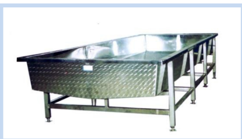
TABLA DE DRENAJE CON / SIN MOLDES