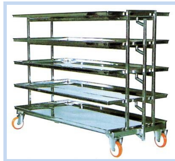
CARRETILLA PARA EL QUESO RICOTTA