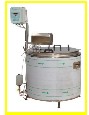
TINAS DE COCCIÓN A GAS GLP/METANO CAP. | 75 - 400