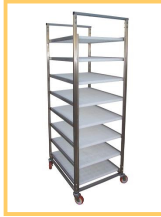
CARRETILLA PARA QUESOS CON ESTANTES EN PE EXTRAÍBLES