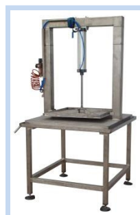
PRESA PARA QUESOS ACTUACIÓN NEUMÁTICA