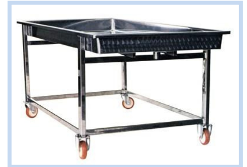
TABLA DE DRENAJE CON / SIN MOLDES