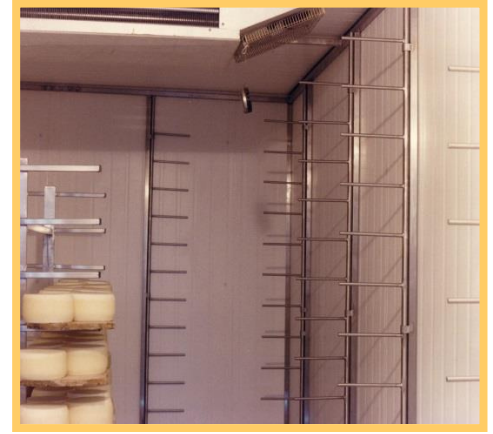
ESTANTERÍA EN ACERO INOX PARA CÁMARA FRÍA