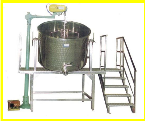
MINIPOLIVALENTES SU SUPORTE CALEFACCIÓN A VAPOR CAP. | 500 - 1500