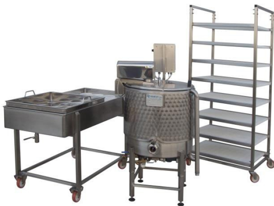
TABLA PARA MOLDES Y BANDEJA DE MOLDES CARRETILLA PARA QUESOS TINAS DE COCCIÓN ELÉCTRICA CAP. DESDE 100 I A PARTIRE DA 100 I