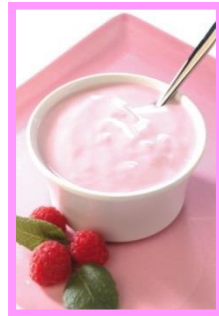
TINAS PARA YOGUR SEMI AUTOMÁTICAS CALEFACCIÓN ELÉCTRICA / VAPOR CAP. DESDE L 15